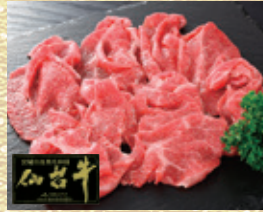
宮城県産 仙台牛 A5等級 特選切り落とし [約200g入・1パック]