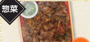
牛タンひつまぶし [1パック]