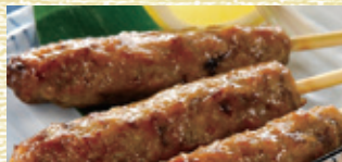
牛タンつくね串 [3本入・1パック]