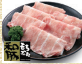
宮城県産 和豚もちぶた ロース しゃぶしゃぶ用 [約250g入・1パック]