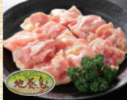
岩手県産 地養鳥 モモ鍋物用 [100gあたり]