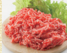
宮城県産 豚挽肉 [100gあたり]