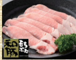
宮城県産 和豚もちぶた 肩ロース切り落とし [約200g入・1パック]