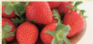
宮城県名取市産 いちごびとのもういっちょいちご (レギュラーパック) [1パック]