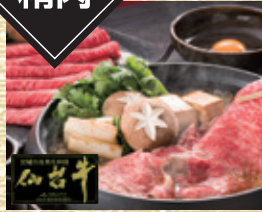
宮城県産 仙台牛 A5等級 肩ロースすき焼用 [約250g入・1パック]