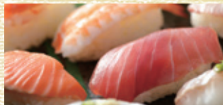
グリーンマート特製 お魚屋さんの生まぐろ入り 大ネタ握り寿司 [6貫入・1人前]