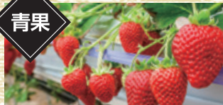
宮城県名取市産 土生農園のとちおとめいちご (レギュラーパック) [1パック]